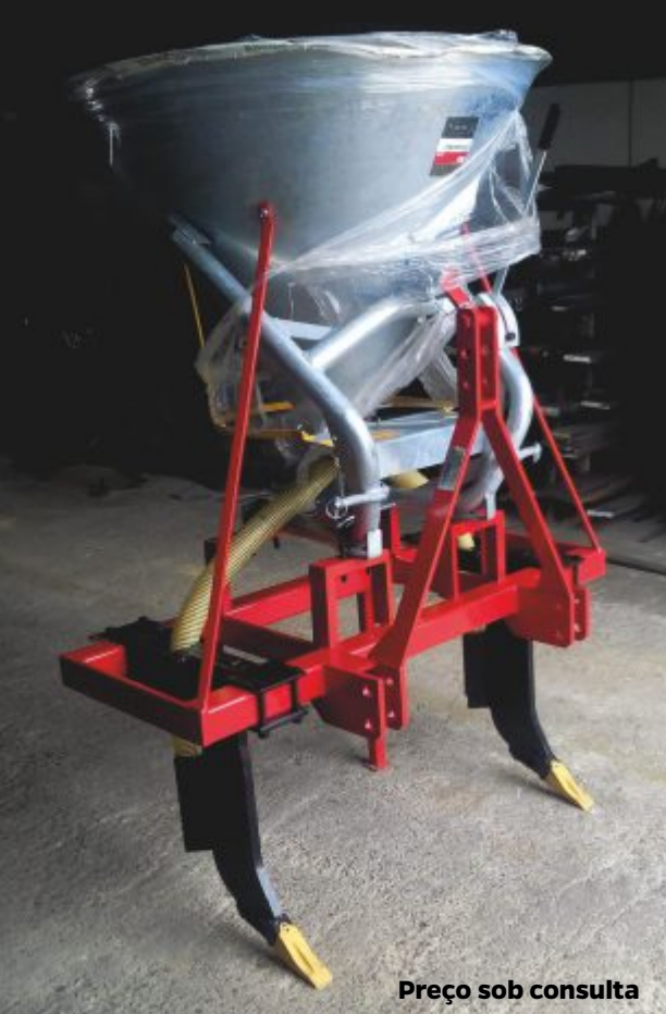
Preço sob consulta