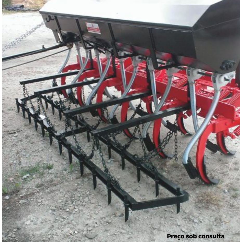
Preço sob consulta